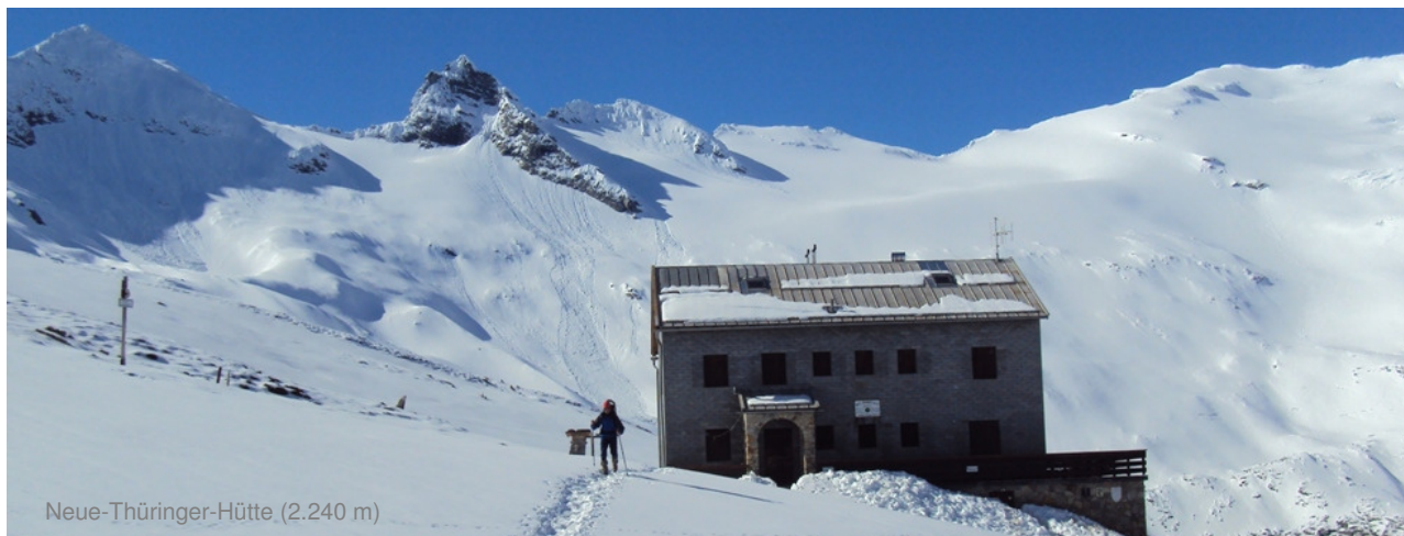
Neue-Thüringer-Hütte (2.240 m)