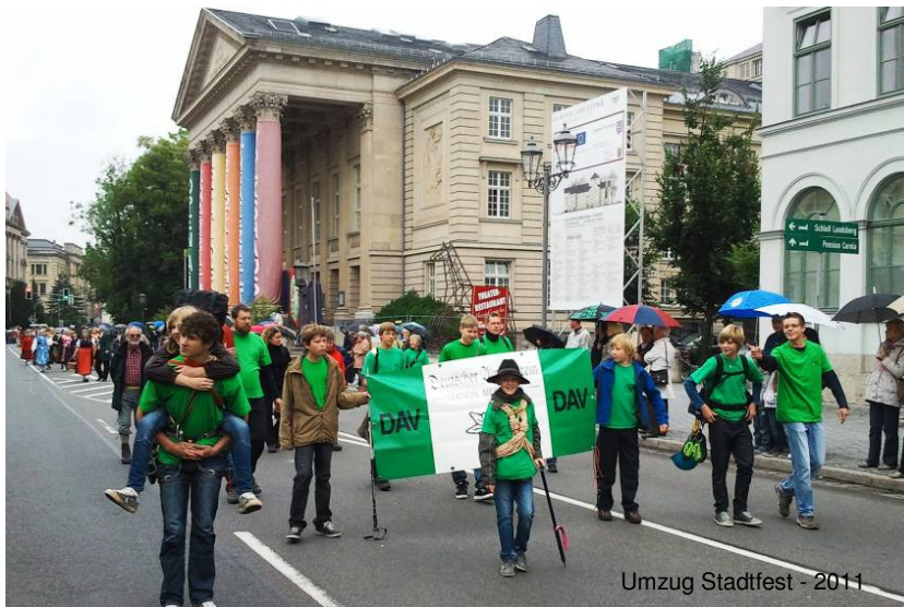
Umzug Stadtfest - 2011

Ein wichtiger Punkt auf der diesjährigen Jahreshauptversammlung war die Anhebung der Mitgliedsbeiträge. In erster Linie bedingt durch die Anhebung der Umlagebeiträge an den Hauptverein wurde es notwendig, dass die Sektion handelt. Im Hauptverein wie hier in der Sektion und bei der vielfältigen ehrenamtlichen Arbeit schlagen sich die immer weiter steigenden Kosten bei Energie, Sprit, Versicherungen usw. auf den Sektionshaushalt nieder. Dem ist wohl alle paar Jahre Rechnung zu tragen.